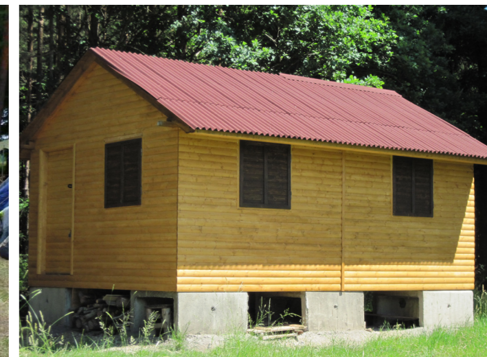
Dětský tábor v Pašovicích.