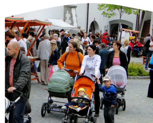
Vltavotýnské farmářské trhy.