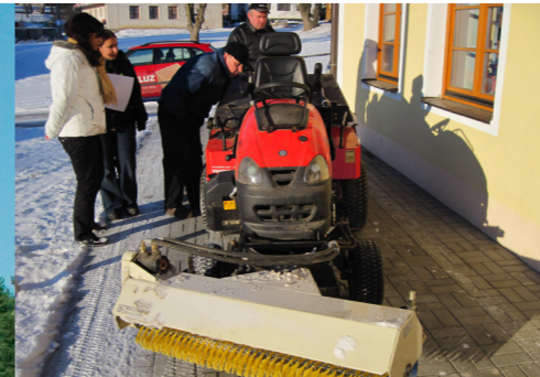
↑ Technika na údržbu veřejného prostranství.

Pokračujeme v projektech spolupráce s ostatními místními akčními skupinami, nyní jsme například zapojeni do projektu Venkovská tržnice.