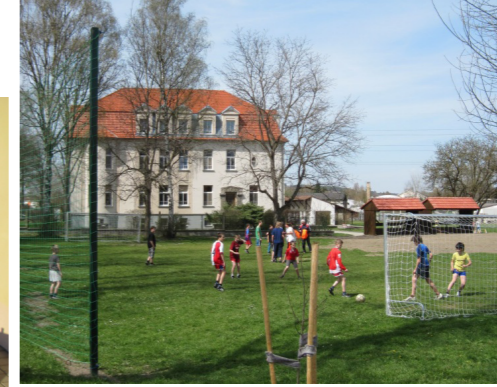
↑ Hřiště (sportovně-kulturní park v Čihovicích) ↑