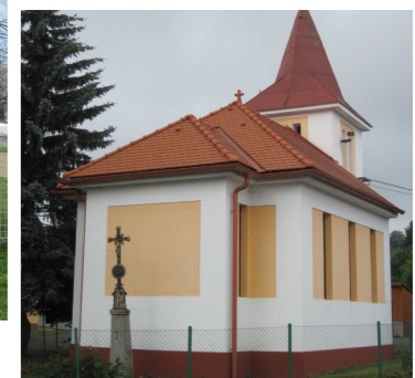
↑ Oprava střechy kaple ve Smilovicích.